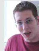
Jobscout24 GmbH, Coburg

Branche: Industrie Partner: Kamm Systems GbR Produkt: genesisWorld