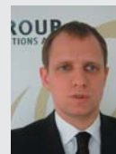
QGROUP Solutions AG, Frankfurt

Branche: Forschung/Lehre Partner: IDV GmbH Produkt: gemeinsamer Einsatz von genesisWorld und CAS teamWorks