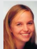
Laser Zentrum Hannover, Hannover

Branche: Touristik Partner: com:con solutions e.K. Produkt: genesisWorld