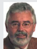
THEN Maschinen- und Apparatebau GmbH, Schwäbisch Hall

Branche: IT Partner: CAS Software AG Produkt: CAS teamWorks