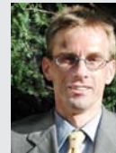
Ferien AG, Neuss

Branche: Dienstleistung Partner: All-to-do e.K. Produkt: genesisWorld