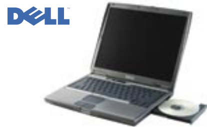
Das Dell Latitude D600 Notebook bietet mobilen Anwendern ultimative Notebook-Leistung. Intel® Pentium® M Processor 1.30GHz, 14.1" TFT Display, 256MB RAM, 20GB Festplatte, CD-RW Laufwerk, Netzwerkanschluss, internes Modem, Win. XP Pro, 3 Jahre Vorort-Garantie, u.v.m. CHF 2375.–

Preise, die sich sehen lassen können. Hier einige Beispiele aus unserem Sortiment, die Ihnen zeigen, wie erschwinglich das grosse Stück Notebook-Freiheit beziehungsweise Ihr neuer, mobiler Arbeitsplatz ist.