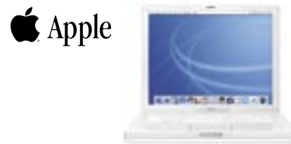
Das Apple iBook ist für alles geeignet. Es wiegt nur 2,2 kg und passt hervorragend in Ihren Rucksack und in Ihr Leben. Details: PowerPC G3 900MHz, 14" TFT Display, 128MB SDRAM, 40GB Festplatte, DVD/CD-RW-Laufwerk, Netzwerkanschluss, internes Modem, Mac OS X, u.v.m. CHF 1990.–

Hinweis: Preise und Modellkonfigurationen ändern sich relativ rasch. Unsere tagesaktuellen Preise erfragen Sie bitte unter: Telefon 062 892 99 79.