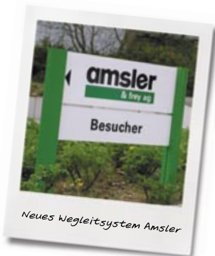
Neues Wegleitsystem Amsler

Mit über hundert Angestellten gehört die Gewerbezone «im Feld» zum grössten Arbeitgeber der Gemeinde Schinznach Dorf (Aargau). Die dort