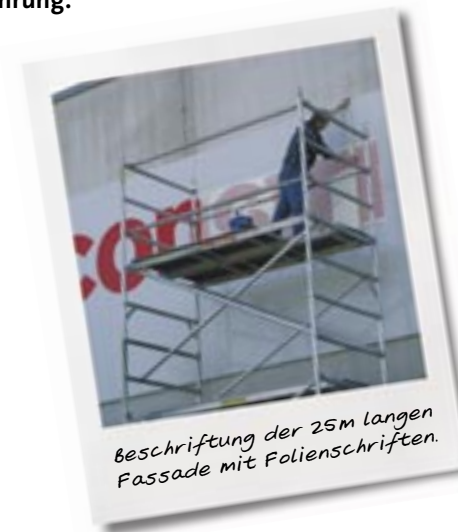
Beschriftung der 25m langen Fassade mit Folienschriften.

hervorragende Akzeptanz bei Bevölkerung und Kunden haben dieses Projekt zu einem weiteren, schönen Erfolg für uns und unseren Kunden gemacht.