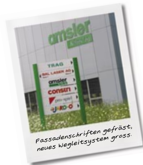
Fassadenschriften gefräst, neues Wegleitsystem gross.

Diverse Gestaltungsvarianten, die sich alle konsequent an der Aufgabenstellung orientierten, wurden dem Kunden zunächst von der Artwin Graphics & Media Abteilung zur Entscheidung vorgelegt. Die dann favorisierte Gestaltung wurde bis ins Detail ausgearbeitet und zeitgleich Pläne und Skizzen für die Baueingabe erstellt.